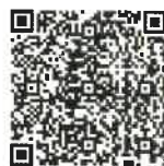
スマートフォン用QRコード